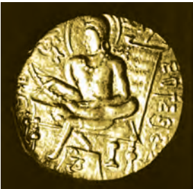
समुद्रगुप्त वीणा बजाते हुए—एक सिक्का

नहीं तोड़ा बल्कि उसके सांस्कृतिक आदर्शों और सामाजिक ढाँचे के लिए भी खतरा पैदा कर दिया। इनके विरुद्ध जो प्रतिक्रिया हुई उसका रूप मूलतः राष्ट्रवादी था। उसमें राष्ट्रवाद की शक्ति भी थी और संकीर्णता भी। धर्म और दर्शन, इतिहास और परंपरा, रीति-रिवाज और सामाजिक ढाँचा, जिसके व्यापक घेरे में उस समय के भारत के जीवन के सभी पहलू आते थे, जिसे ब्राह्मणवाद या हिंदूवाद कहा गया, वह इस राष्ट्रवाद का प्रतीक बना। यह दरअसल राष्ट्रीय धर्म था, जिससे वे तमाम गहरी जातीय और सांस्कृतिक प्रवृत्तियाँ प्रभावित हुईं जो आज हर जगह राष्ट्रीयता की बुनियाद में मौजूद हैं। जिस बौद्ध धर्म का जन्म भारतीय विचार से हुआ था, उसके लिए भारत वह पुण्य भूमि थी जहाँ बुद्ध ने जन्म लिया, उपदेश दिया और वहीं उनका निर्वाण हुआ। पर बौद्ध धर्म मूल रूप में अंतरराष्ट्रीय था, विश्वधर्म था। जैसे-जैसे उसका विकास और विस्तार हुआ वैसे-वैसे उसका यह रूप और विकसित होता गया। इसलिए पुराने ब्राह्मण धर्म के लिए स्वाभाविक था कि वह बार-बार राष्ट्रीय पुनर्जागरण का प्रतीक बने।