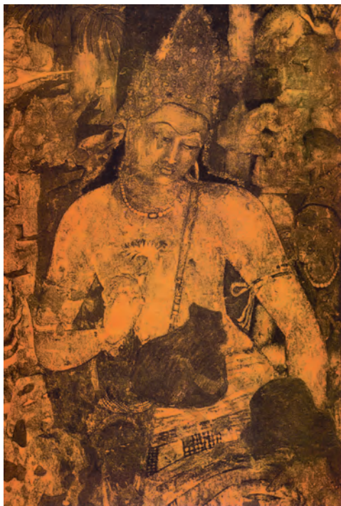
अजंता का एक चित्र

सातवीं-आठवीं शताब्दियों में ठोस चट्टान को काटकर एलोरा की विशाल गुफाएँ तैयार हुईं, जिनके बीच में कैलाश का विशाल मंदिर है। यह अनुमान करना कठिन है कि इंसान ने इसकी कल्पना कैसे की होगी या कल्पना करने के बाद अपनी कल्पना को रूपाकार कैसे दिया होगा। एलीफेंटा की गुफाएँ भी इसी समय की हैं जहाँ प्रभावशाली और रहस्यमयी त्रिमूर्ति बनी है। दक्षिण भारत में महाबलीपुरम् की इमारतों का निर्माण भी इसी समय हुआ था।