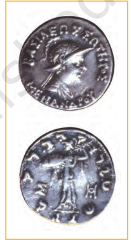
हिंद-यूनानी शासक मेनांडर का एक सिक्का

मध्य-एशिया में शक (सीदियन) लोग ऑक्सस (अक्षु) नदी की घाटी में बस गए थे। यूइ-ची सुदूर पूरब से आए और उन्होंने इन लोगों को उत्तर-भारत की ओर धकेल दिया। ये शक बौद्ध और हिंदू हो गए। यूइ-चियों में से एक दल कुषाणों का था। उन्होंने सब पर अधिकार करके उत्तर-भारत