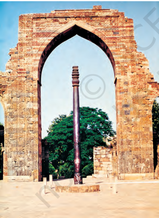
महरौली (दिल्ली) में कुतुबमीनार के परिसर में खड़ा लौह-स्तंभ, जिसका निर्माण लगभग 1500 साल पहले हुआ

जाता था। भारतीय रेशम उद्योग ने बाद में विकास किया, लेकिन बहुत नहीं। कपड़े को रँगने की कला में उल्लेखनीय प्रगति हुई और पक्के रंग तैयार करने के खास तरीके खोज निकाले गए। इनमें से एक नील का रंग था, जिसे अंग्रेज़ी में 'इंडिगो' कहते हैं। यह शब्द इंडिया से बना है और अंग्रेज़ी में यूनान के माध्यम से आया है।